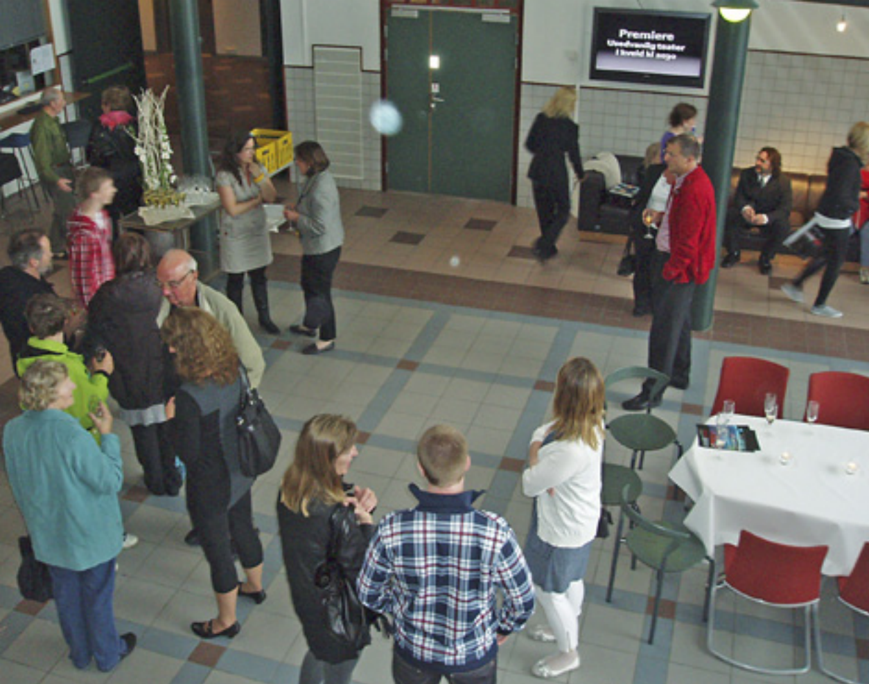
Premierekveld på «Usedvanlig teater»