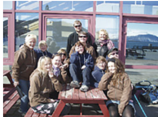
Gjengen fra «Usedvanlig teater» samlet utenfor Kulturhuset i Harstad.

Et eksempel på bruken av teaterets virkemidler kan igjen være scenen der den synshemmede personen ble forlatt av ledsageren ved et gangfelt: Når «Usedvanlig Teater» improviserte frem denne scenen var bestillingen fra SOR en scene som skulle vise at «En hjelper må vise seg tilliten verdig». Gruppen ønsket å vise en scene der tillit brytes, og der man som tjenesteyter i etterkant må jobbe for å